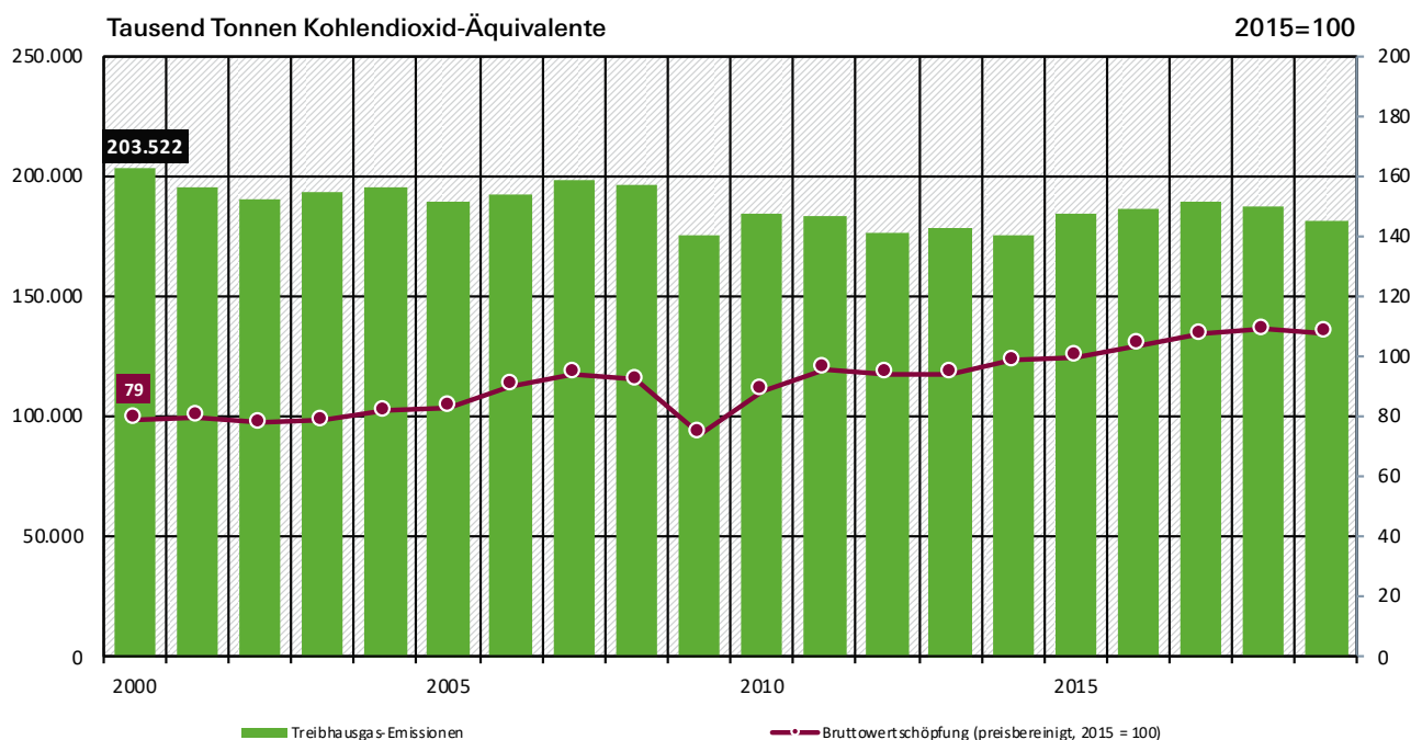
Abbildung 1: Treibhausgasemissionen des verarbeitenden Gewerbes, 2000–2019

Der Verkehrssektor wiederum sorgt für etwa 19 Prozent aller CO 2 -Emissionen in Deutschland. Rund zwei Drittel davon gehen auf den Pkw-Verkehr zurück, der in den zurückliegenden 30 Jahren (gemessen in Personenkilometern) um knapp ein Drittel zugenommen hat; der Straßengüterverkehr hat in diesem Zeitraum seine Verkehrsleistung sogar fast verdoppelt. Trotz